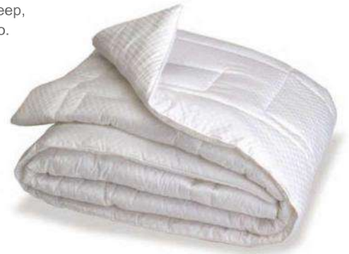
Edredón Kenko Dream® Comforter